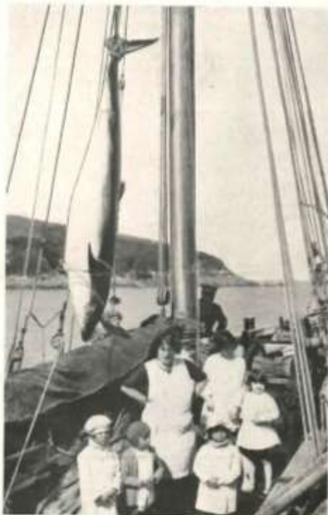
Beluga de 300 kilos capturé avec fusil lance-harpon Gastine-Renette en 1931, à Dolom (Côte-du-Nord).

Les photographies reproduites pages 1 et 8 sont dues à l'obligeance d'un de nos Clients.