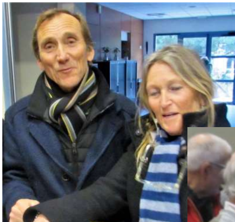
Ou un peu moins connus ...