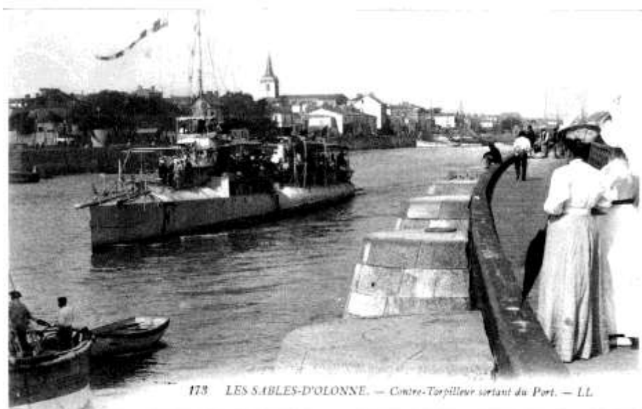
Un Contre Torpilleur pour tuer les Dauphins ...