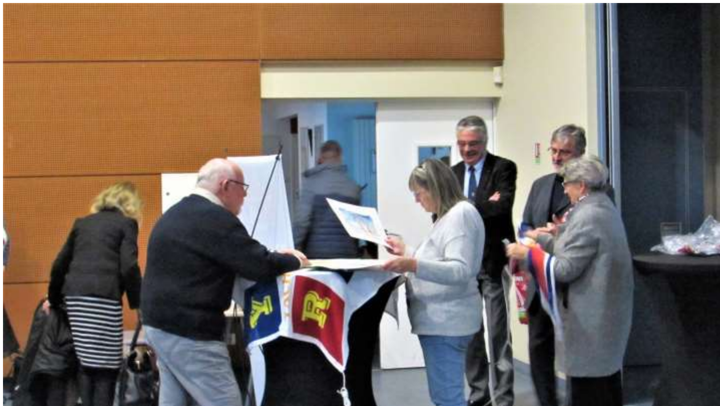
Les participants arrivent