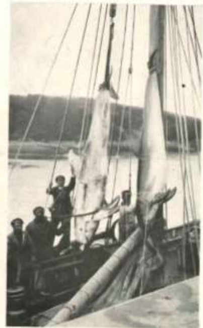
Belugas de 250 et 450 Kg capturés avec fusil lance-harpon Gastine Renette

FUSILLANCE HARPON GASTINE - RENETTE 39 avenue Victor Emmanuel III - Paris 6 ème