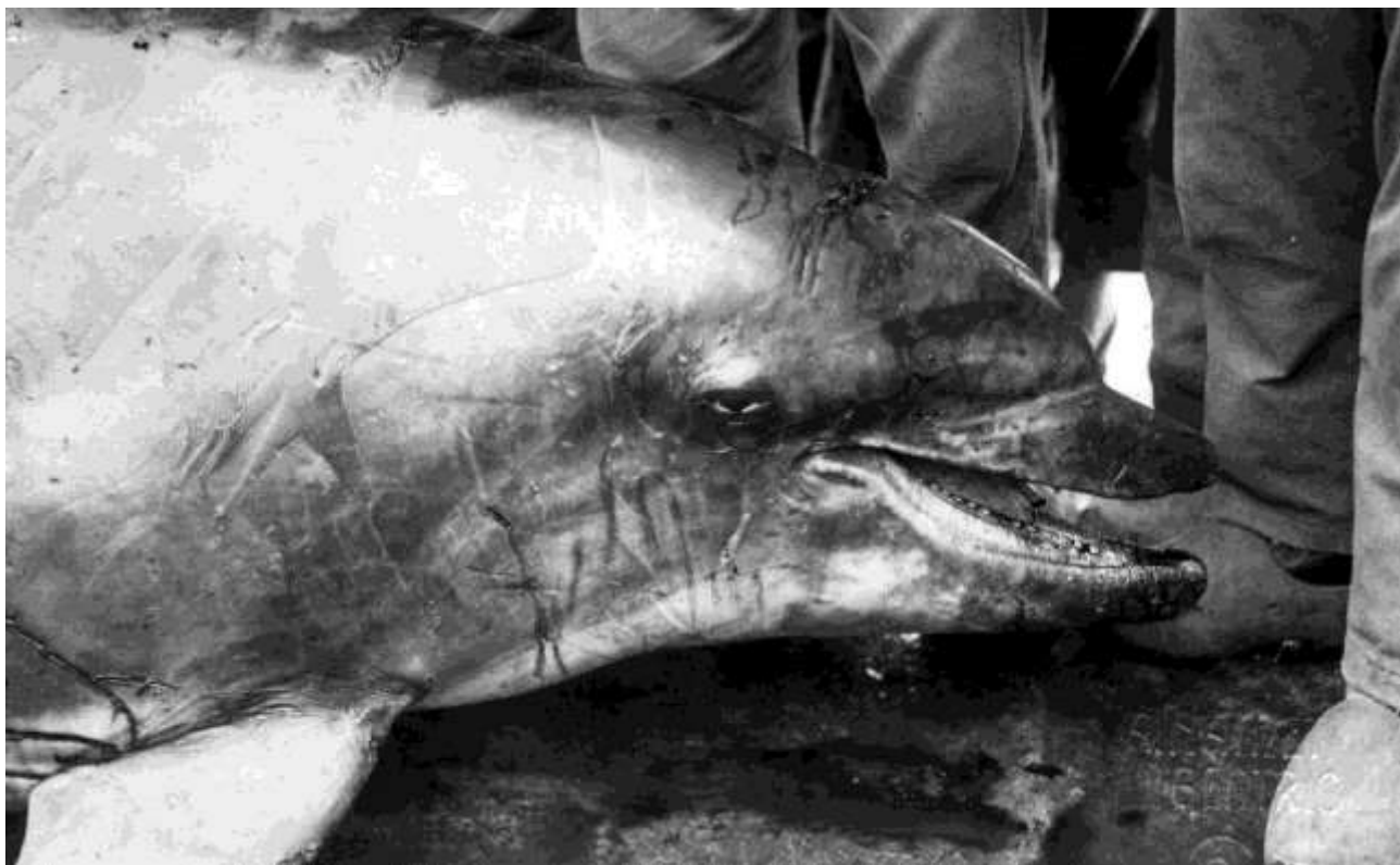
Dauphins sur une brouette à Marans.