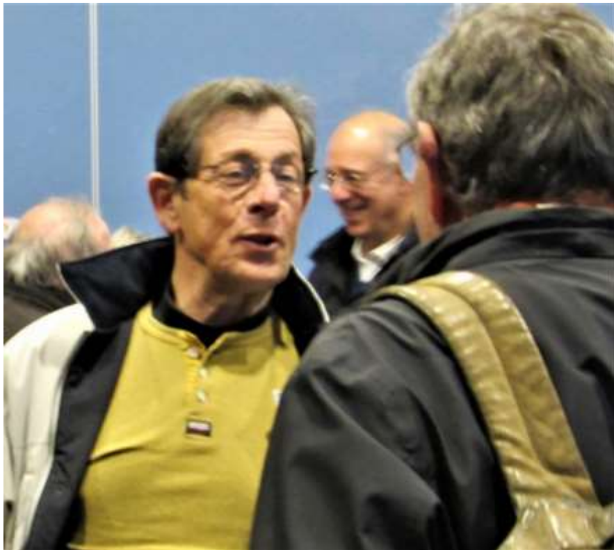
Des participants connus .....