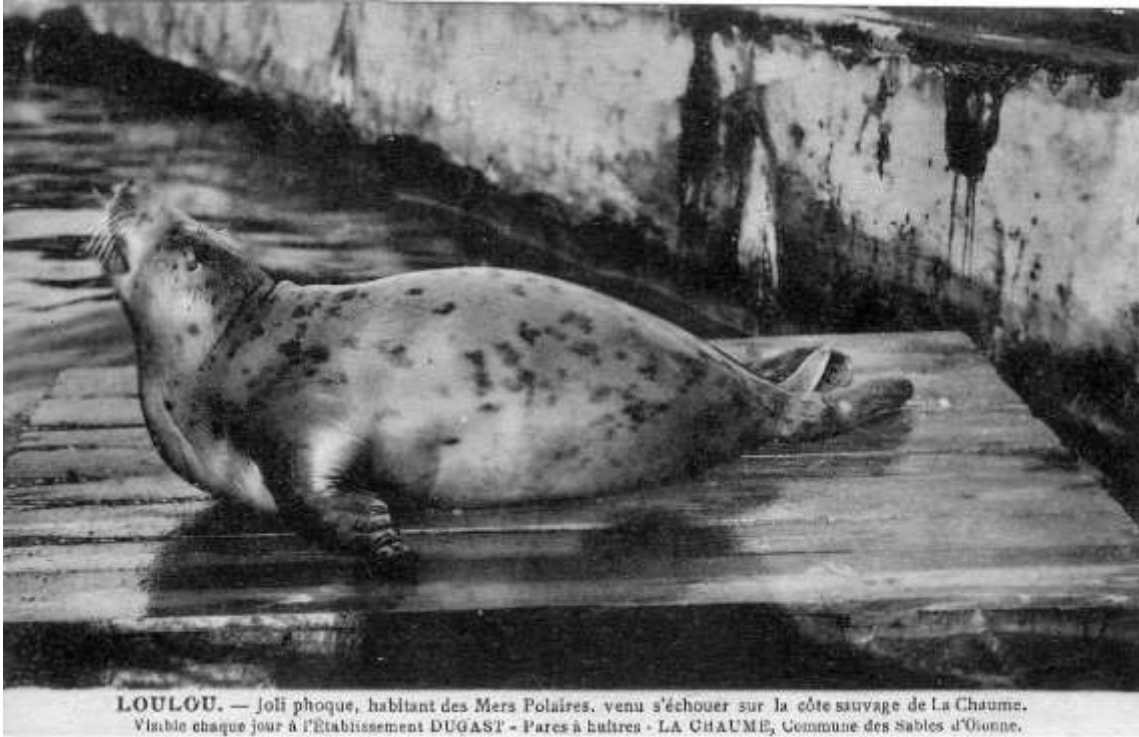
LOULOU. — Joli phoque, habitant des Mers Polaires, venu s'échouer sur la côte sauvage de La Chaume. Visible chaque jour à l'Établissement DUGAST - Pares à huîtres - LA CHAUME, Commune des Sables d'Olonne.

P hoque : la prime de 10 Francs pour tuer un Phoque en Vendée